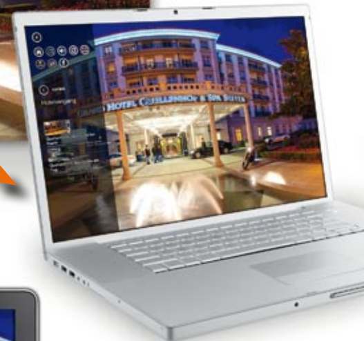
Laptop / PC